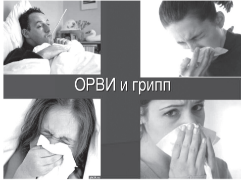
ОРВИ и грипп

Лъагалида жанир цо нухалъгаги гьал церехун рехсарал унтабаз толаро инсан унтичлого. Кинаб кIваркъей чорхое гьабуниги, гьал унтаби къезаризе кIолеб гьечIо. КIого батIияб цIар